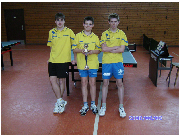
Jugendpokalsieger TSV Neckarau