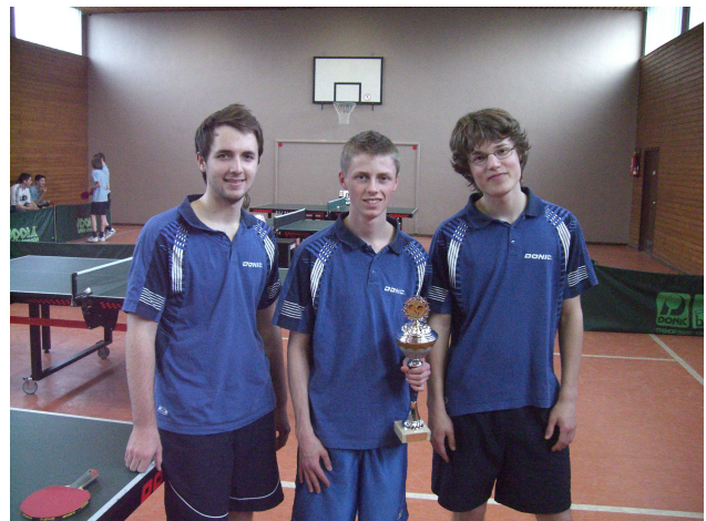
Kreispokal Mannheim.