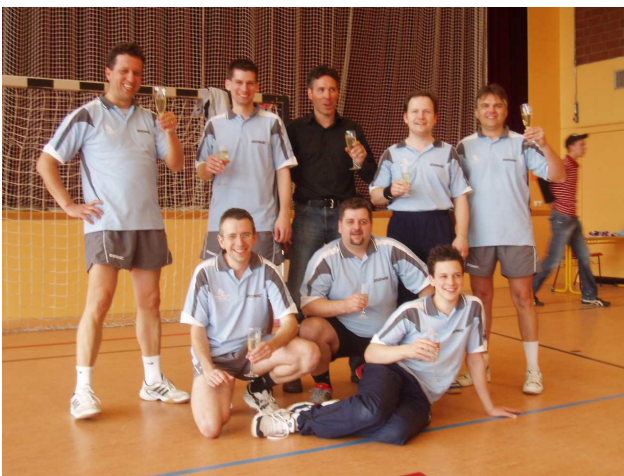
Der TTV Mühlhausen wurde Meister der Bezirksliga Mitte und steigt in die Verbandsklasse auf.