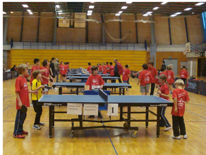
2009 Ludwigsburg | Rundsporthalle

Ob bei "Jugend trainiert für Olympia" oder einem Schul-TEAM-Cup: Die Kooperationsschulen des Programms dürfen sich innerhalb der Schulsport-Initiative auf jährliche Einladungen zu attraktiven Tischtennis-Schul-Wettkämpfen in größeren Hallen freuen.