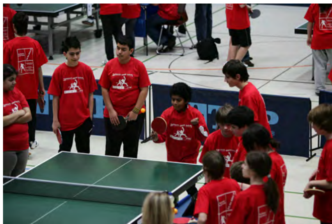
2010 Aalen | Greuthalle