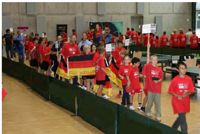
2009: Stuttgart | Benz-Arena