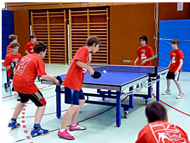
2011 Frickenhausen | Sporthalle auf dem Berg